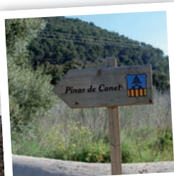
HITO DE MADERA