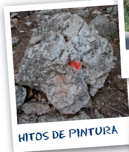
HITOS DE PINTURA

En Mallorca, la mayoría de senderos suelen estar marcados con montículos de piedras (hitos). Algunos están marcados con la señalización internacional (GR, PR o SL). Es muy común encontrar hitos de piedras, pintadas (hitos de pintura que marcan la dirección que hay que seguir en un sendero).