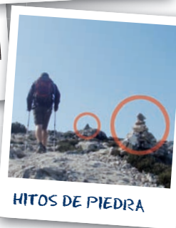
HITOS DE PIEDRA